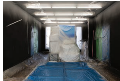
© Arno Gisinger, Die Nacht für den Boden