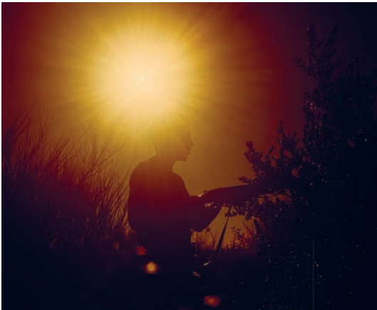
Espace arts plastiques Madeleine-Lambert, Vénissieux © Marine Lanier, Zéclipse , 2018 Jörg Brockmann (Genève)