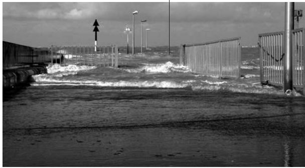
Mapraa © Valerie Berge, Vagues et bitume

Mardi — mercredi — samedi, 14 h 30 → 18 h 30 Jeudi — vendredi, 11 h → 12 h 30 et 14 h 30 → 18 h 30