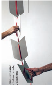
© Chloé Serre, Sans titre , 2018, aluminium, corde, polyester, plastique

11, quai de Pêcherie — 69001 Lyon T. 04 78 28 66 63 labf15.org