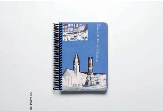
Le CAP © Nicolò, Herman , exposition au Muséon de Bozano, 2017

Avec le projet Icare ou la nuit , Thaïva Ouaki mêle photographies, dessins et documents d'archives pour réaliser une composition qui prend sa source dans le poème d'Ovide Les Métamorphoses . La référence au mythe est avant tout un prétexte, qui s'inscrit dans une recherche plus large sur les thèmes de l'enfermement, du dépassement de soi et de la liberté par-delà les limites prescrites. Agencées au mur de façon libre, les images dévoilent un récit qui se donne sans enjeu de narration. Pas de protagonistes, pas d'unité de lieu ou de temps, pas de lecture linéaire, pour un tableau dont le sens émerge après coup, dans la synthèse.